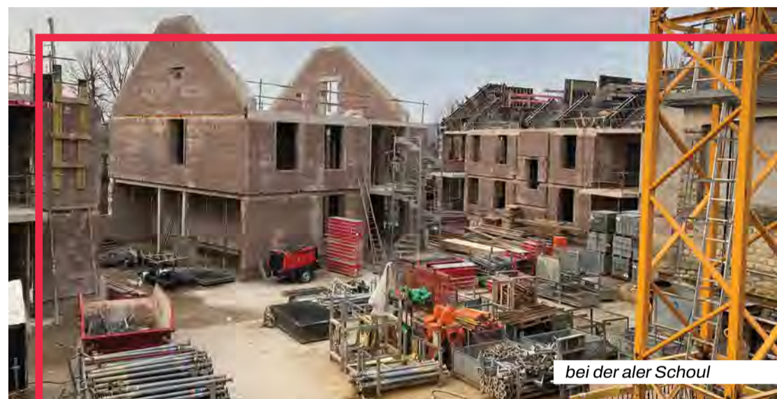
bei der aler Schoul

nungsbaus werden wir die Planung zum Bau eines neuen Mehrfamilienhauses in der „Grand-rue“ in Roeser beginnen, wo die Idee auch besteht, im Erdgeschoss ein Geschäftslokal zu schaffen. Ein anderer Schwerpunkt ist für diese Legislaturperiode die Renovation, bzw. der teilweise Neubau der Krautemer Grundschule, sowie der Bau einer neuen Sporthalle in Berchem. In diesem Jahr wollen wir die Planung der genannten Sportinfrastruktur vornehmen, um dem Gemeinderat spätestens